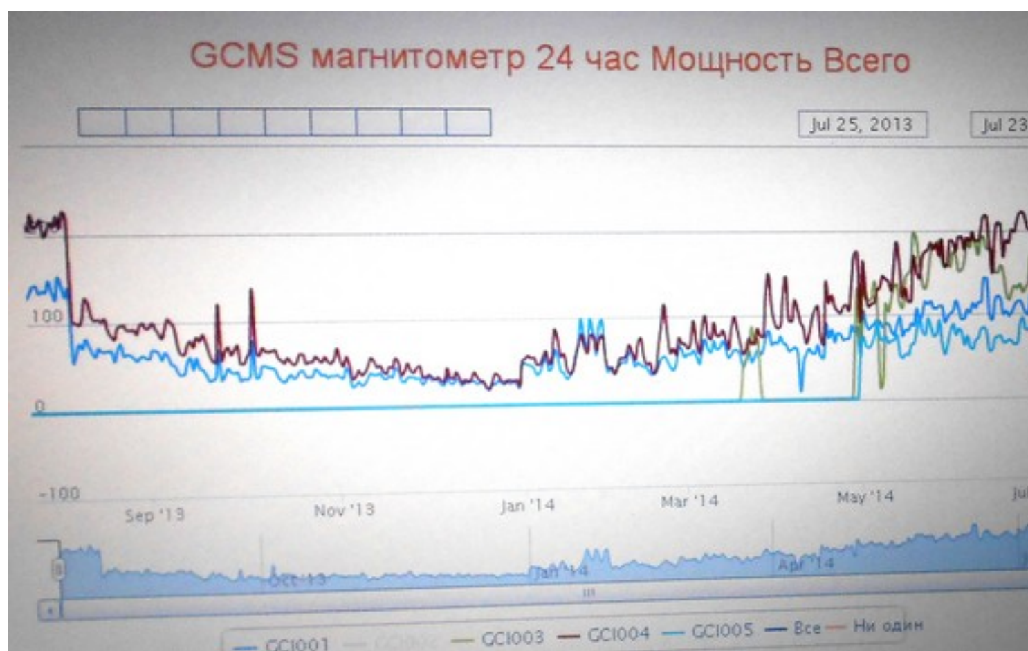
Рис.1. Динамика изменений магнитного поля за год 2013 и 2014.

Если рассмотреть динамику изменений магнитного поля за год 2013 и 2014 (см. рис.1), то видно, что показатели магнитного поля резко упали 8 августа, и продолжали падать до конца 2013 года.